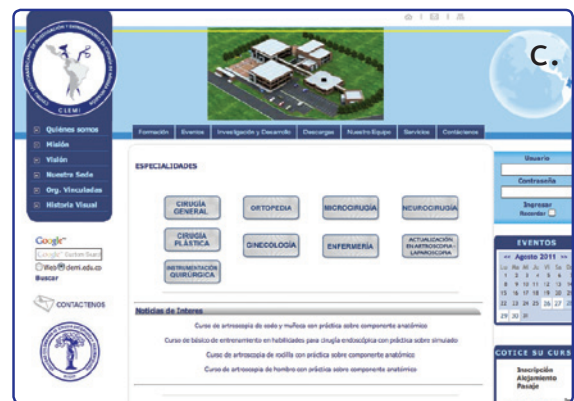
Figura 5. Páginas web de la sociedad. a) www.sccot.org.co . b) www.sccot.edu.co . c) www.clemi.edu.co .

En mayo del 2002 se lanzó el portal llamado La ortopedia.com , primera comunidad virtual de Ortopedia en Iberoamérica diseñada para cumplir las necesidades de nuestra especialidad en español y portugués. El portal está dirigido a cirujanos ortopédicos y profesionales afines y