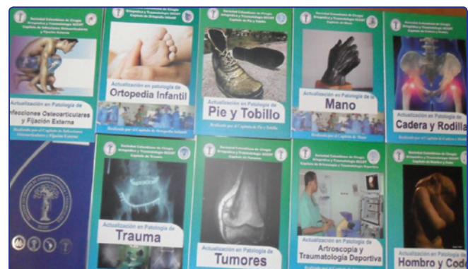
Figura 7. Libros de actualización en ortopedia.