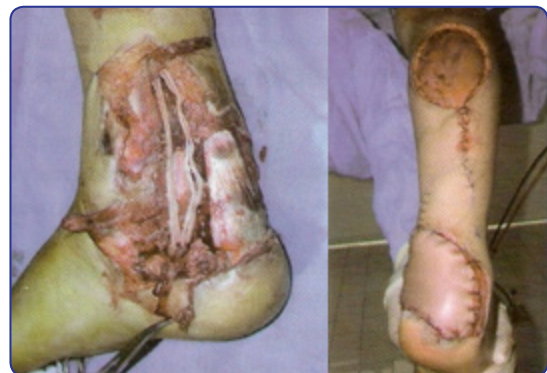
Figura 1. Injertos nerviosos en el nervio tibial posterior y colocación de un colgajo sural invertido para cubrir el defecto.

Lo considero un excelente cirujano reconstructivo de las lesiones de partes blandas del sistema locomotor; es un pionero y abanderado en la enseñanza y práctica de injertos, colgajos de piel y fasciocutáneos en isla para cubrir exposiciones de hueso y de la mano (figura 1), siguiendo los pasos del Dr. Roberto Laignelet quien en 1964, al regresar de su especialización en cirugía de la mano en Inglaterra con el Dr. Pulvertaf, a los residentes nos enseñó y nos motivó a practicar estos procedimientos.