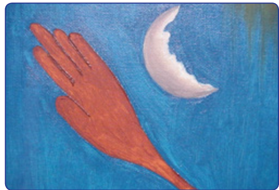
Figura 3. Detalle de mano (óleo y lienzo, 2007).

Es un hombre de excelentes cualidades humanas, gran docente, hábil cirujano y prolífero investigador. En el escaso tiempo libre que le deja el ejercicio profesional, se dedica a cultivar el arte de la pintura; sus manos plasman en los lienzos sus pensamientos artísticos, algunas pinturas se publican en la Revista de Ortopedia y sirven para recrear la cansada visión de los lectores (figura 3).